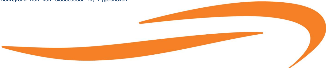
Bart van slobbestraat 16 Eygelshoven Limburg